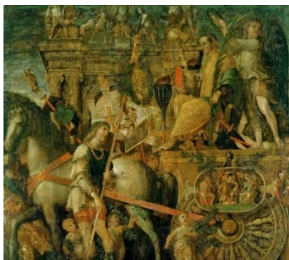
5. Andrea Mantegna, Trionfo di Cesare, tela IX, Londra, Palazzo Reale di Hampton Court

Desideriamo fare qualche osservazione sulla tela IX con Cesare in trionfo (Fig. 5) ove sono stati raffigurati da Mantegna alcuni elementi iconografici tratti dall'antico e riconducibili, a nostro parere, all'ambito laurenziano.