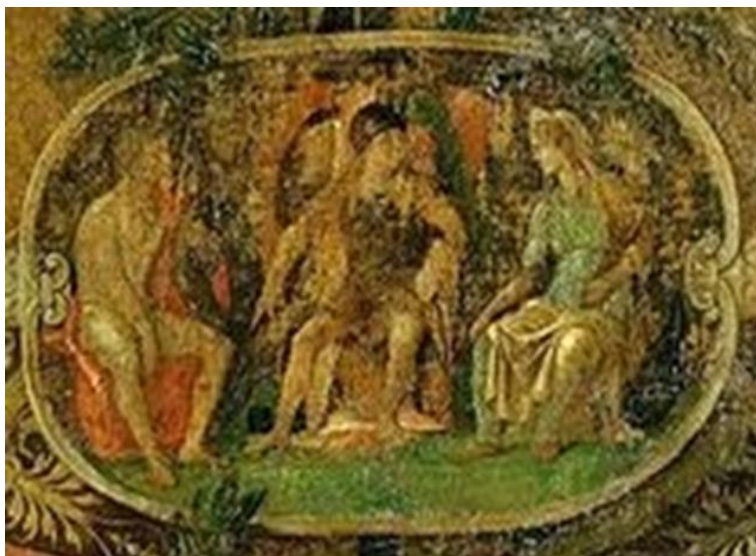
8. Andrea Mantegna, Trionfo di Cesare, Tela IX, dettaglio dello scudo ad ornamento del carro trionfale di Cesare

Marte e Florentia : un'altra immagine presente nella tela IX con Cesare in trionfo e a nostro parere riconducibile all'ambito laurenziano è quella in cui potrebbe essere ravvisato il dio Marte, seduto al centro dello scudo che orna il carro trionfale, tra un uomo ignudo e una figura femminile 65 (Fig. 8).