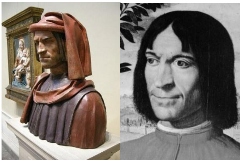
Da sinistra: 2. Artista fiorentino, Lorenzo de' Medici, da un modello di Verrocchio e Orsino Benintendi, XV-XVI secolo, Washington, National Gallery of Art; 3. Girolamo Macchietti, Ritratto di Lorenzo il Magnifico, XVI secolo, dettaglio, coll. privata.