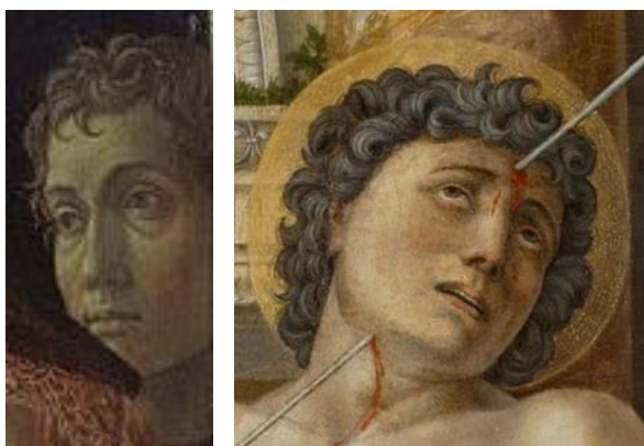
Da sinistra: 18. Andrea Mantegna, Presentazione al Tempio , dettaglio dell'autoritratto, Gemäldegalerie di Berlino. 19. Andrea Mantegna, San Sebastiano , dettaglio, Kunsthistorisches Museum di Vienna

San Sebastiano viene ritratto da Mantegna più volte, ricordiamo le opere conservate al Kunsthistorisches Museum di Vienna, al Louvre di Parigi e alla Ca' d'Oro a Venezia.