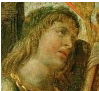
11. Andrea Mantegna, Trionfi di Cesare (1486-1492), tela IX, Londra, Palazzo Reale di Hampton Court, dettaglio del volto del giovane coronato in primo piano