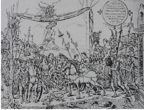
16. Incisore fiorentino, Il trionfo di Paolo Emilio , Londra, British Museum

Come ha chiarito Paola Ventrone: “I trionfi di Paolo Emilio voluti dal Magnifico si inseriscono in questa componente delle celebrazioni patronali, forse come temporanea sostituzione dei tradizionali carri religiosi, immettendovi i semi della cultura classica con la proposta