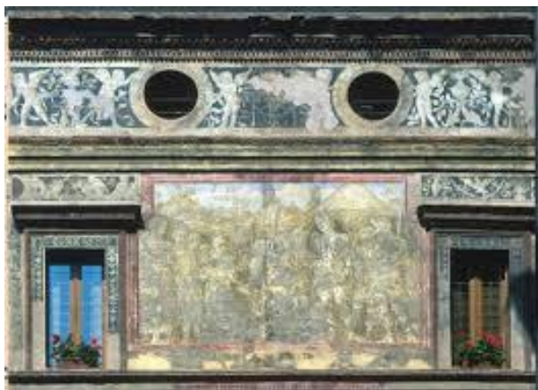
17. Andrea Mantegna, La clemenza di Alessandro, 1495 circa, affresco della facciata della Casa Viani-Tallarico, Mantova

(Fig. 17), o Casa del Mercato, in piazza Marconi a Mantova, databile, secondo gli studiosi, al 1495 155 .