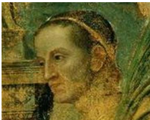
1. Andrea Mantegna, Trionfi di Cesare, tela IX, dettaglio del volto di Giulio Cesare, Londra, Palazzo Reale di Hampton Court

generosità di questi essere stata ripagata; mostrando come l'in-