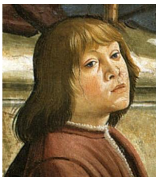
10. Domenico Ghirlandaio (1482-1485), Piero de' Medici, Cappella Sassetti.

Nelle tele VIII e IX del Trionfo mantegnesco, abbiamo individuato in primo piano tre giovani personaggi dai capelli biondi con visi ameni, rivolti, con sguardi e gesti, verso Cesare; nei loro volti, secondo noi, possono essere riconosciuti i tratti dei figli di Lorenzo