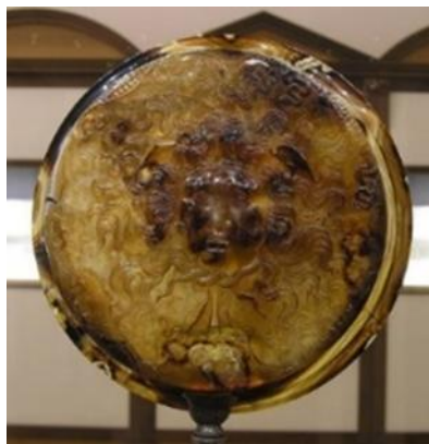
7. Tazza Farnese, esterno, cameo in sardonice del II secolo avanti Cristo, dalla collezione di Lorenzo de' Medici, Museo archeologico di Napoli

Infatti, al tempo in cui venne realizzato il Trionfo di Cesare il pezzo più pregiato e famoso della collezione laurenziana era la Tazza Farnese che presentava nel verso la testa di Medusa (Fig. 7);