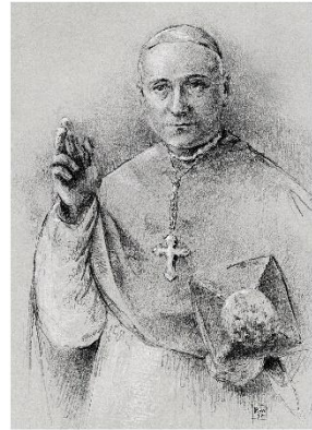
Monsignor Vescovo DON FELICE DOTT. DEL SORDO VESCOVO DI ALIFE

La diocesi di Alife, interamente collocata nella Campania settentrionale, durante il primo quarto del XX secolo fu guidata da monsignor Felice del Sordo 1 , nato nell'alta Irpinia, a metà dell'Ottocento, dal facoltoso notaio Pietrantonio, esponente di spicco dell'agiata borghesia locale 2 . Nell'atto di conferirgli il regio exequatur , prodromico al trasferimento in diocesi alifana, il Consiglio dei ministri del Regno d'Italia, assunte informazioni sul conto di monsignor del Sordo, dovette convenire, che esse erano, sotto ogni riguardo e a tacer d'altro, estremamente favorevoli, essendosi il presule dimostrato di "condotta morale e politica incensurabile" 3 . Consecutivamente, e con spedita progressione cronologica, monsignor del