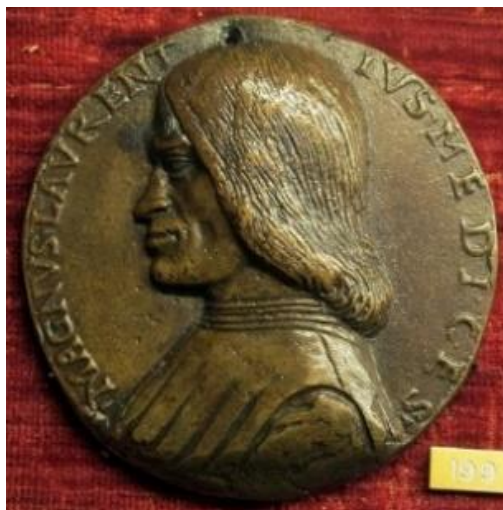
4. Niccolò di Forzore Spinelli, Medaglia di Lorenzo de' Medici, 1490 circa, Firenze, Museo Nazionale del Bargello