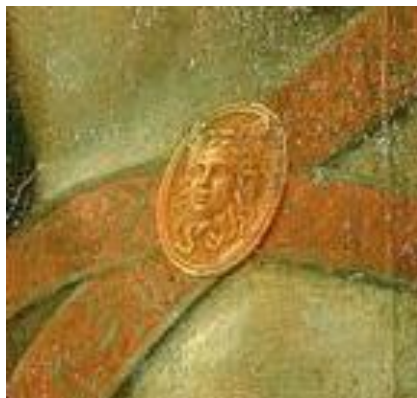
6. Andrea Mantegna, Trionfo di Cesare , tela IX, dettaglio della bardatura del cavallo cesareo; a destra:

I due leoni, secondo noi, significherebbero che l'albero della Virtù deve essere custodito, non solo perché non venga sfrondata irragionevolmente da coloro che intendono fregiarsi senza meriti, ma che la Virtù va difesa strenuamente e con coraggio 60 . Il leone è anch'esso emblema di Firenze e dei Medici.