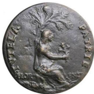
9. Spinelli, Medaglia di Lorenzo de' Medici, bronzo, Firenze, Museo del Bargello

Femina figurante Firenze con giglio in mano all'ombra di un lauro. Tutela Patria 72 .